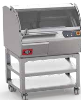
Wszystkie wymiary podano w mm